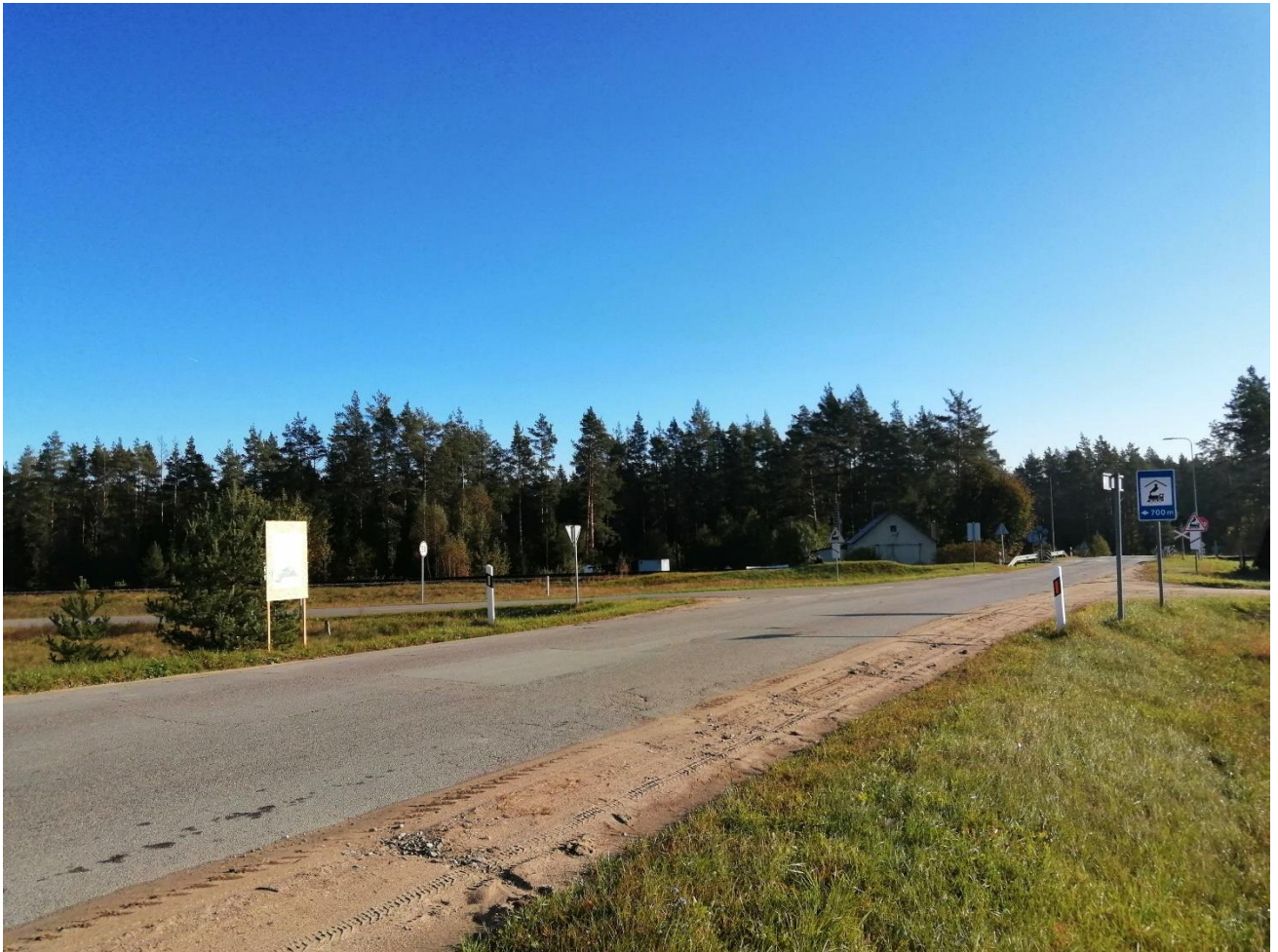
Pav. 5 Informacinis stendas kelio Nr. 176 Pirčiupiai–Jašiūnai 23,617 km