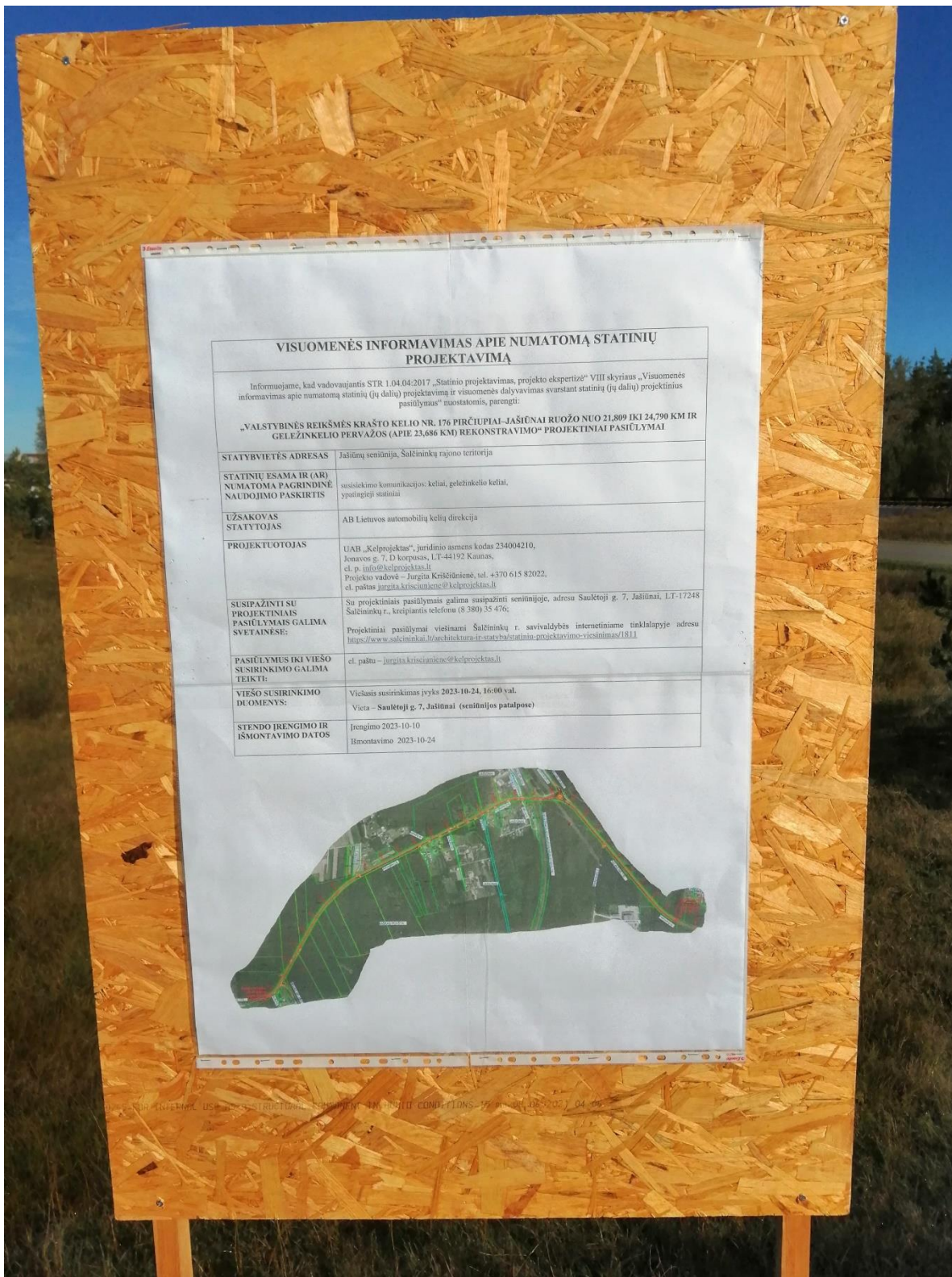
Pav. 4 Informacinis stendas kelio Nr. 176 Pirčiupiai–Jašiūnai 23,617 km