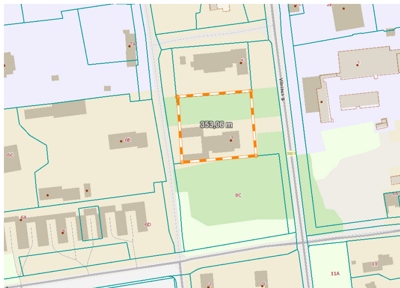
Ištrauka iš regia.lt

DP koregavimo tikslai: koreguoti statybos zoną ir statybos ribą.