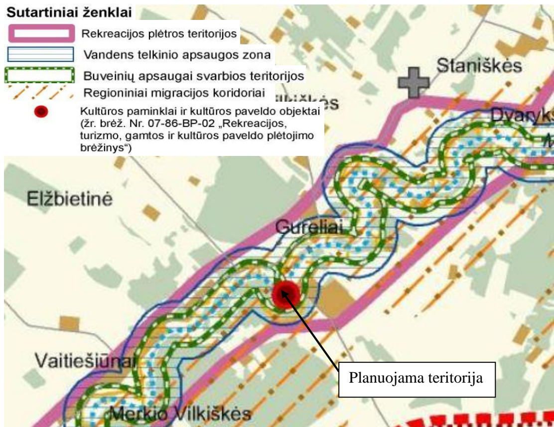
2 pav. Ištrauka iš Šalčininkų rajono savivaldybės teritorijos bendrojo plano brėžinio „Žemės naudojimas ir apsaugos reglamentai“