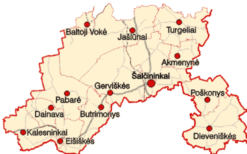
1.1.1. pav. Šalčininkų rajono savivaldybė

Rajone yra 13 seniūnijų (žr. 1.1.1 pav.): Akmenynės seniūnija, Baltosios Vokės seniūnija, Butrimonių seniūnija, Dainavos seniūnija, Dieveniškių seniūnija, Eišiškių seniūnija, Gerviškių seniūnija, Jašiūnų seniūnija, Kalesninkų seniūnija, Pabarės seniūnija, Poškonių seniūnija, Šalčininkų seniūnija, Turgelių seniūnija.